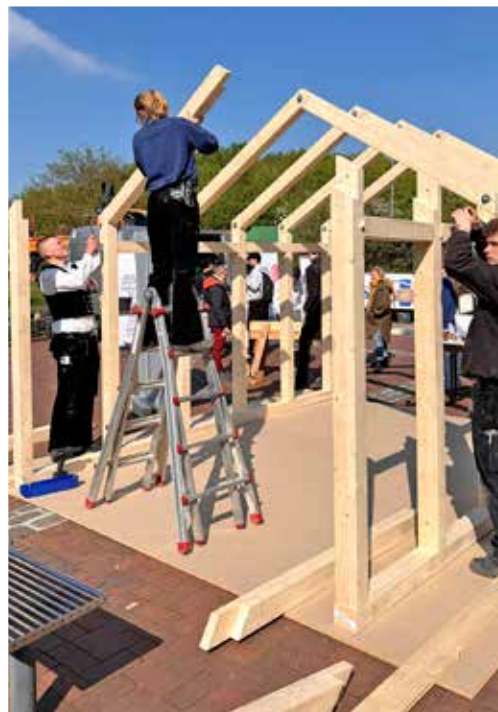
Draußen gab es viele Informationen zu den Berufen im Handwerk, vor den Flottmannhallen zogen unter anderem die Tischler die Blicke auf sich.