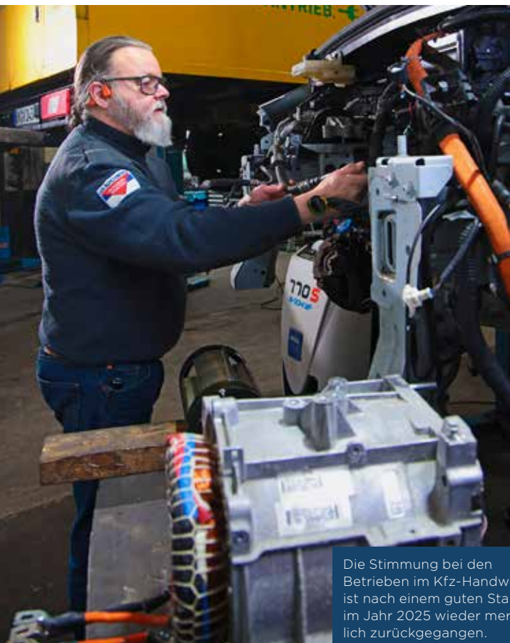
Die Stimmung bei den Betrieben im Kfz-Handwerk ist nach einem guten Start im Jahr 2025 wieder merklich zurückgegangen.

Zum akuten Kostendruck kommt damit ein langfristiges Problem: Fehlende Nachfolge, überalterte Betriebsstrukturen und sinkende Investitionsbereitschaft greifen ineinander. Das macht die aktuelle Umfrage für das Handwerk politisch brisant. Denn die Sorgen der Betriebe richten sich nicht nur auf Energie-, Material- und Lohnkosten, sondern auch auf fehlende Planbarkeit. Schröder forderte deshalb mehr Verlässlichkeit und weniger Bürokratie. Wenn diese Rahmenbedingungen nicht verbessert würden, werde es schwerer, „Modernisierung, Klimaschutz, Wohnungsbau und Versorgung mit der nötigen Geschwindigkeit umzusetzen“. Dass sich die Preisspirale weiterdrehen könnte, ist keineswegs ausgeschlossen. Schon jetzt rechnen 40 Prozent der Betriebe mit weiteren Preissteigerungen im kommenden Halbjahr. Die Botschaft der Umfrage ist damit zweigeteilt: Das Handwerk funktioniert noch, aber es zehrt zunehmend von seiner Substanz. Stabilität ist da – Rückenwind nicht.