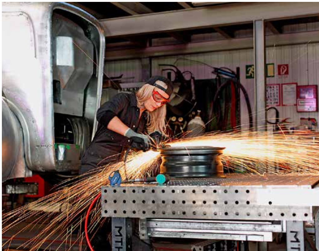
Starke Frauen, starke Fotos: Der jährliche Photo.Award der HWK Dortmund macht auf das Potential weiblicher Fachkräfte aufmerksam. Im letzten Jahr haben sich 150 Fotografinnen und Fotografen aus ganz Deutschland beteiligt.

Deutschland rechtsextreme Parteien an die Macht, würde das traditionelle Rollenbild der Hausfrau und Mutter wieder propagiert. Auch Einflüsse, die aus anderen Kulturen einfließen, sollten wir wahrnehmen und darauf reagieren. Ein Beispiel: Im Ruhrgebiet wollten neulich zwei männliche Auszubildende mit Migrationshintergrund nicht mit einer Prüferin reden und ihr nicht die Hand geben, weil das in ihrer Kultur verboten sei. Die betreffende Innung stellte auf ihrer Innungsversammlung klar: Ein solches Verhalten ist inakzeptabel. Wer eine Prüferin nicht respektiert, wird eben nicht geprüft. Dass Frauen im Handwerk nicht nur mitarbeiten, sondern sich dort ganz bewusst beruflich verwirklichen wollen, kommt auch in der aktuellen Debatte um den Fachkräftemangel zu kurz. Laut Institut der Deutschen Wirtschaft (IW) ist die Zahl der Handwerksmeisterinnen seit 2013 um gut 7.000 gestiegen; ihr Anteil unter den Meistern kletterte von 13 auf über 17 Prozent. Besonders erfreulich: Auch in klassischen Männerdomänen wie Hoch-