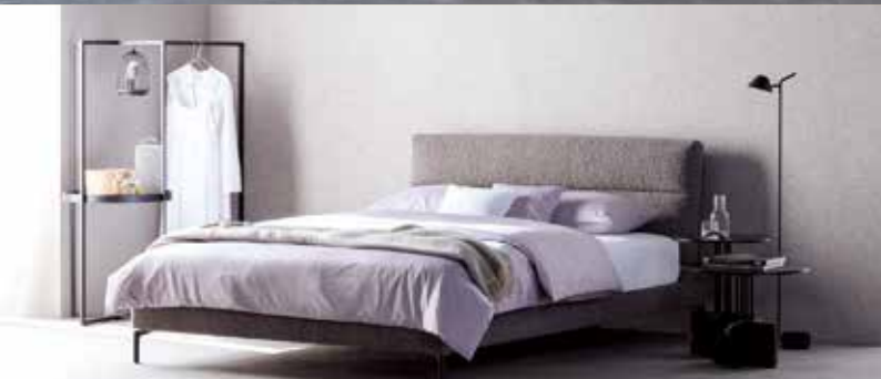
ORIGINS COMPLETE | CLEO