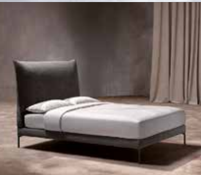
ORIGINS COMPLETE | ARCO